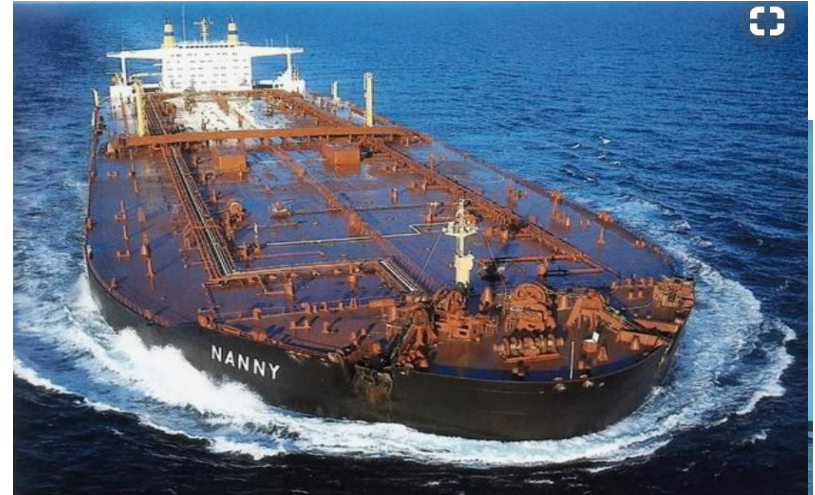
Drift, anskaffelser og investeringer