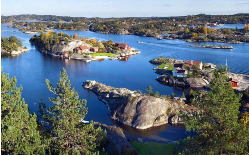
Forskning og innovasjon