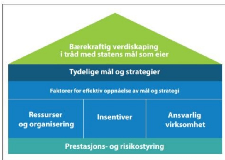
Figur 12.2 Forventningsområder innenfor virksomhetsstyring.

Meldingen slår fast at OECDs retningslinjer for flernasjonale selskaper om ansvarlig næringsliv er det mest omfattende settet med retningslinjer for ansvarlig virksomhet og inkluderer hensynene i FNs veiledende prinsipper for næringsliv og menneskerettigheter (UNGP) og ILOs kjernekonvensjoner. Meldingen redegjør også for hva det innebærer at selskaper forventes å gjennomføre aktsomhetsvurderinger.