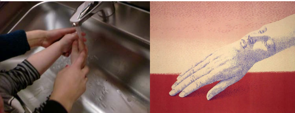
The Indiscreet Jewels (Les Bijoux Indiscrets) Magritte, 1963

«Det er når den profesjonelle yrkesutøveren involverer seg praktisk og konkret i ein profesjonell aktivitet, at den profesjonelle kompetansen og kunnskapen vert konkretisert og verkeleggjort. Det er da fagelege standardar og etiske prinsipp får praktisk meaning. Den samhandlinga som den praktiske involveringa krev, skaper også viktige vilkår for profesjonell yrkesutøving (Måseide, 2008, s. 369)».