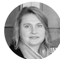
Britt Meling Procuror În Moldova: februarie 2009 - martie 2010