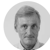
Torolv Groseth Judecător la Curtea de Apel

În Moldova: martie 2011 - iunie 2013; Șef al misiunii: martie 2012 - iunie 2013