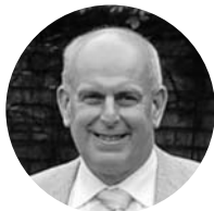
Dag Brathole Judecător la Curtea de Apel Frostating

În Moldova: ianuarie 2010 - februarie 2012; Șef al misiunii: iulie 2010 - februarie 2012