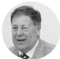
Iver Huitfeldt Judecător la Curtea de Apel Oslo Șef al Misiunii: martie 2007 - aprilie 2008