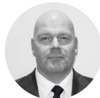
Kim Ekhaugen Expert în domeniul penitenciar

În Moldova: martie 2011 - iunie 2013; Șef al misiunii: martie 2012 - iunie 2013