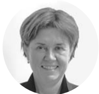
Inger Wiig Judecător

În Moldova: în perioada februarie 2014 - iunie 2015