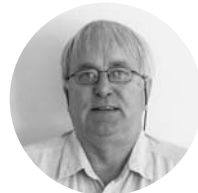
Hans Inge Jørstad Șef de penitenciar

În Moldova: septembrie 2013 - martie 2015