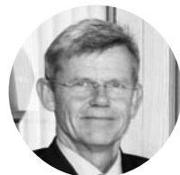
Ivar Svengård Judecător În Moldova: aprilie 2009 - decembrie 2009