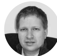
Espen Solberg Rinnan

În Moldova: martie 2007- februarie 2009; Şef al misiunii: aprilie 2008 - februarie 2009; Noi mandate: august 2010 - ianuarie 2012; mai 2015 - ianuarie 2016