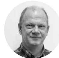
Yngve Skovly Procuror-polițist

În Moldova: septembrie 2013 - martie 2015