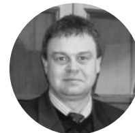
Bjørn Larsen Procuror În Moldova: noiembrie 2007 - iunie 2010 Nou mandat: septembrie 2012 - februarie 2014