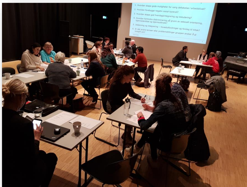
Foto: Gruppearbeid i Bodø