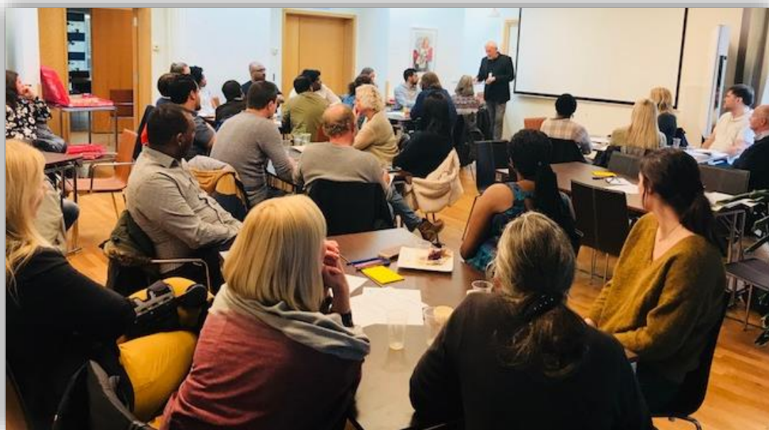
Gruppearbeid i Trondheim

Innvandrere er motiverte for å starte ett nytt liv og ta i bruk muligheter som finnes. Det er ønskelig å raskt fortsette påbegynte studier og få tilbake et «vanlig» liv.